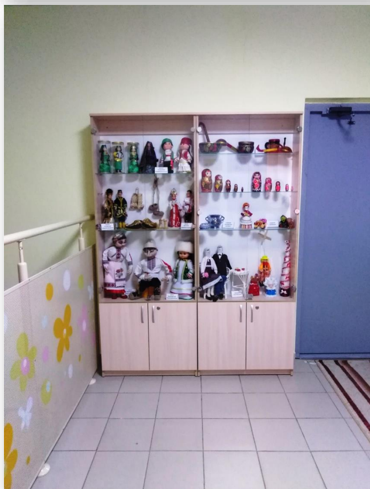
Выставочный «Музей игрушки»